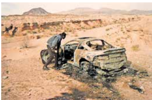
▲ Foto van Mitch Epstein (VS), uit de serie 'American Power'.

Wat: Foto-expo 'In Time' van Mitch Epstein Waar: Kunsthal Museum Helmond Wanneer: Te zien tot en met 9 februari